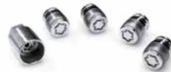
23) Sperrbare Radmuttern & Schlüssel