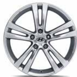
16) Leichtmetallfelge 18" Busan