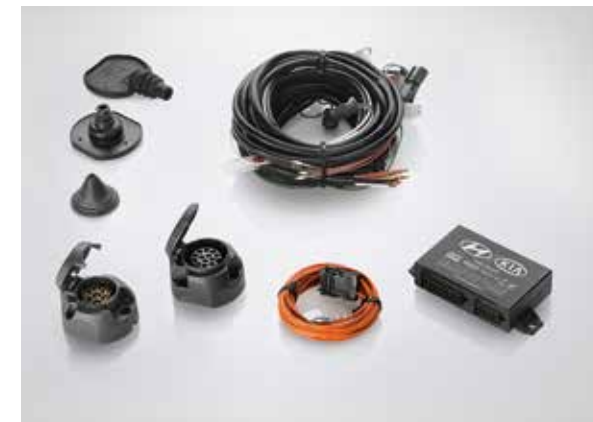
42) Kabelsatz (Symbolfoto)