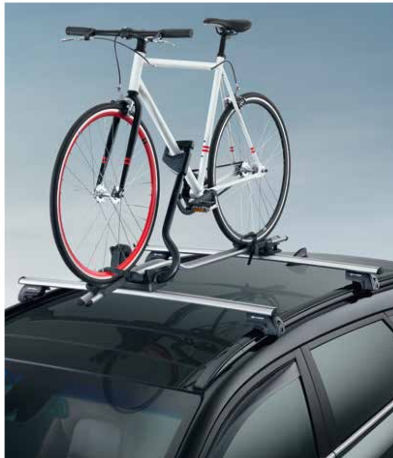
34) Fahrradträgeraufsatz Pro