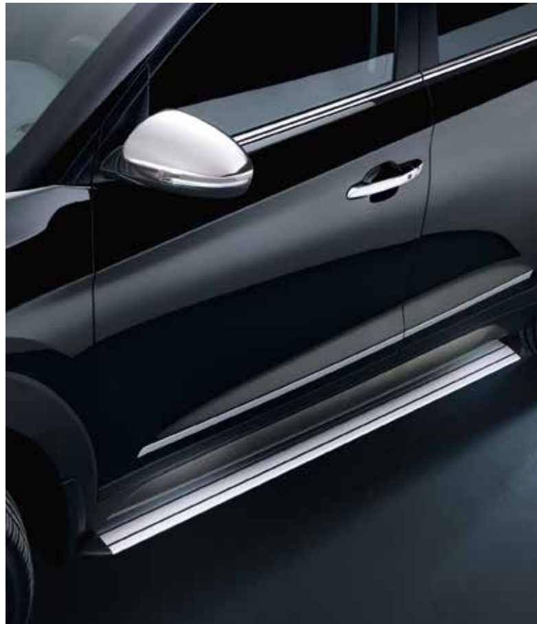
5.2) Spiegelkappen-Satz, Chromoptik