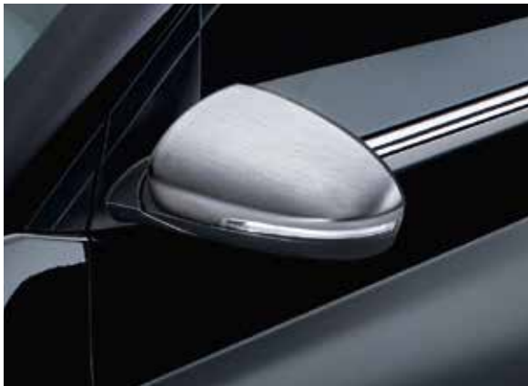
5.1) Spiegelkappen-Satz, gebürstet