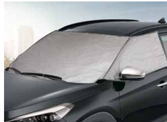
47) Eis- & Sonnenschutz