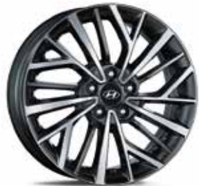
15) Leichtmetallfelge 18"

Sicherheit und ein optimal gewährleistetes Fahrverhalten haben höchste Priorität. Mit dem TPMS-Kit werden die Luftdruckwerte jederzeit überwacht. 52933C1100 (1 Sensor/ohne Abbildung)