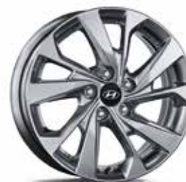
19) Leichtmetallfelge 17"