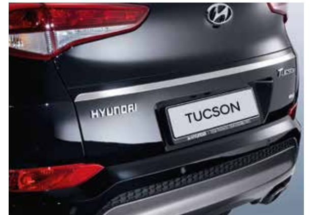
7.2) Heckklappenzierleiste, Chromoptik