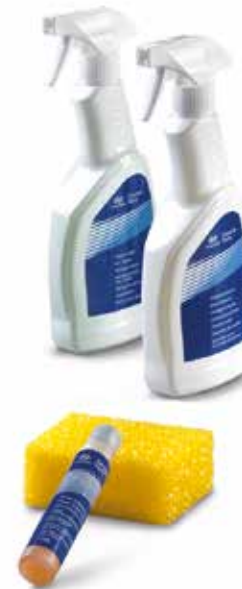
Sommer Pflege Kit

Mehr Schutz, mehr Glanz: die fortschrittliche Lackschutzformel schützt Ihre Lackierung vor den Auswirkungen von Verschmutzungen, Lösungsmitteln, Straßensalz, Autowäschen und Vogelablagerungen. LP982APE1BROH (Bronze Paket) LP982APE1SILH (Silber Paket) LP982APE1GOLH (Gold Paket)