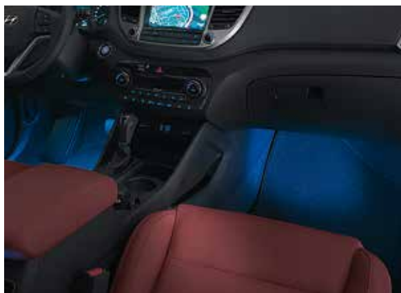
4.1) LED Fußraumbeleuchtung, 1. Reihe, blau