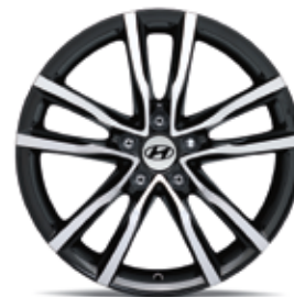
17) Leichtmetallfelge 18" Ulsan