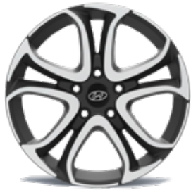
24) Leichtmetallfelge 16"/17" Milano