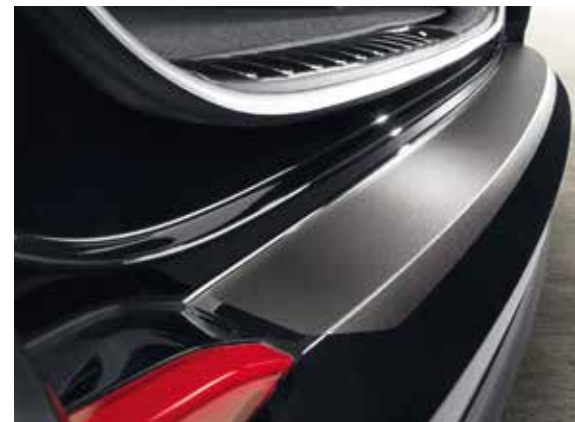
58) Ladekantenschutzfolie, schwarz