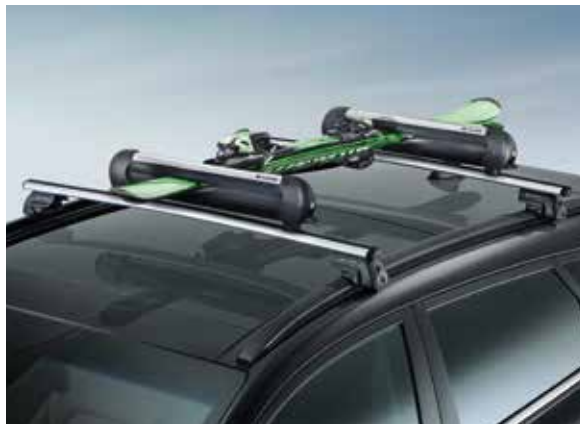
32) Ski- & Snowboardträgeraufsatz 400

99701ADE90 (U-mount Adapterkit für Grundträger aus Stahl)