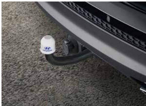
40) Anhängervorrichtung, starr