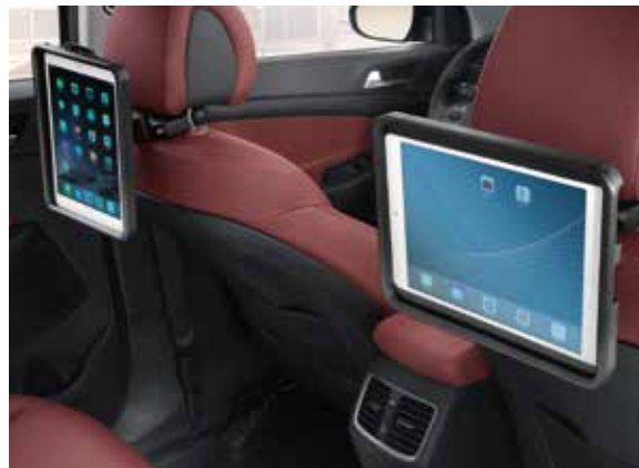
46) Nackenstützhalterung iPad®