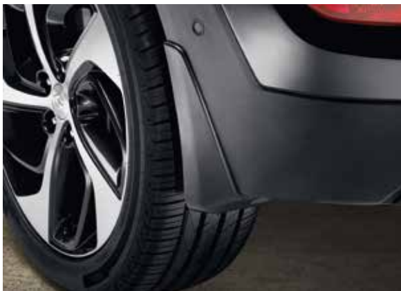
54.2) Schmutzfänger, hinten