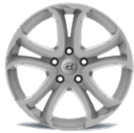
25) Leichtmetallfelge 16"/17" Milano