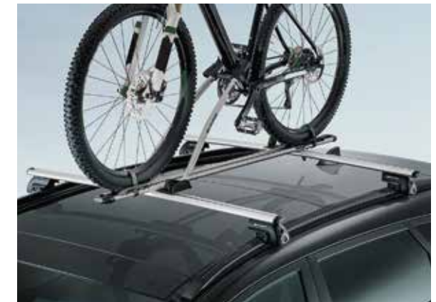
35) Fahrradträgeraufsatz Active

99730ADE00 (Abmessungen: 195x73.8x36cm/390L)