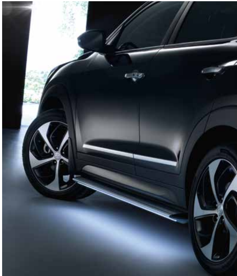
9.2) Seitenzierleisten, Chromoptik & 10) Trittbrett-Satz, beleuchtet