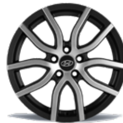
29) Leichtmetallfelge 19" Ancona