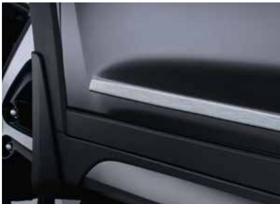
9.1) Seitenzierleisten, gebürstet