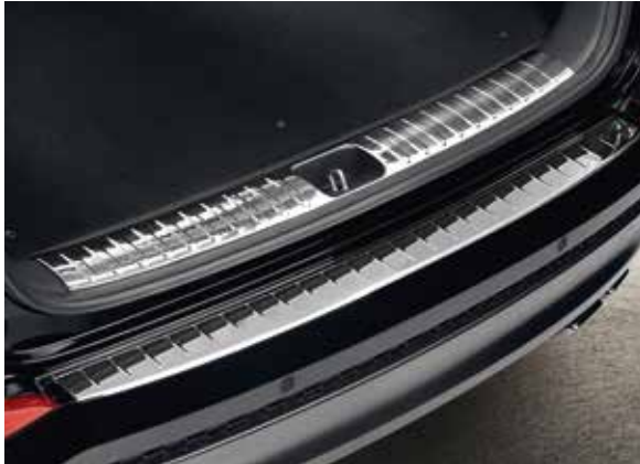
59.1) Ladekantenschutz & 60.1) Ladekantenschutz Innen (Chromoptik)