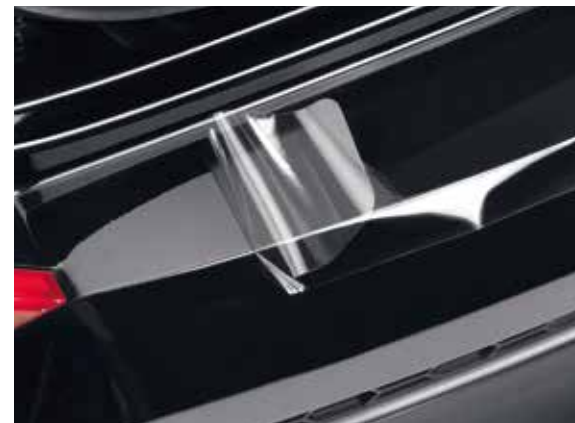
57) Ladekantenschutzfolie, transparent