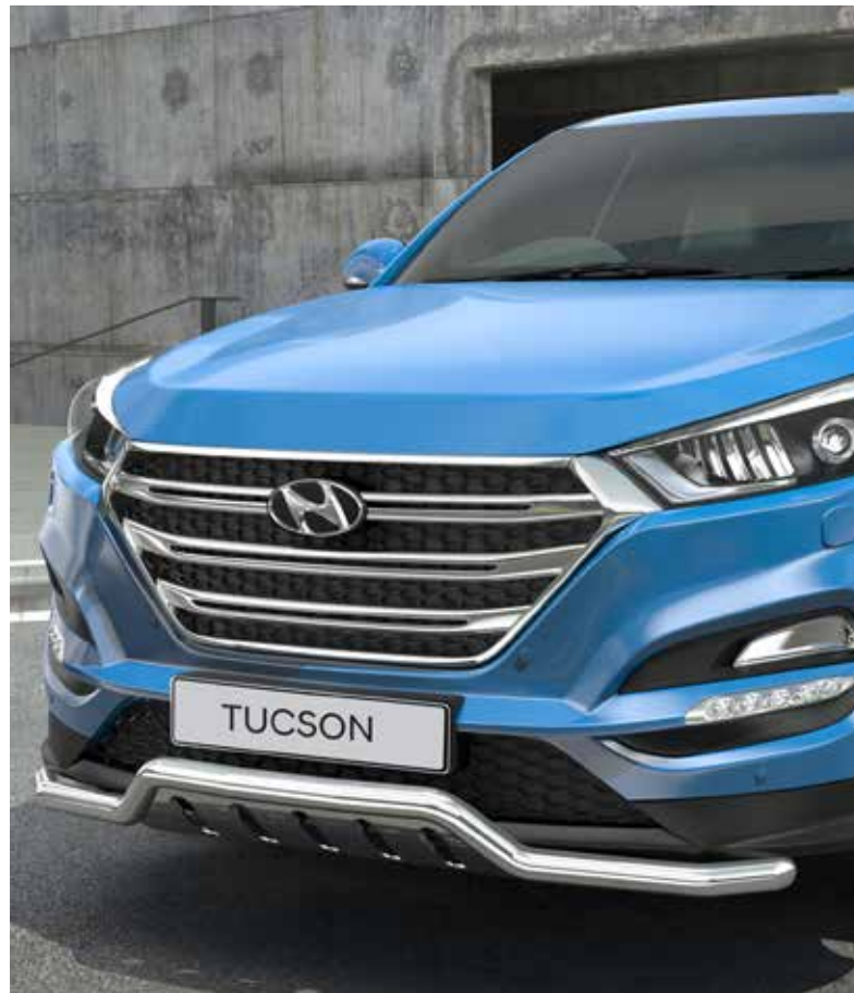
12) Spoilerrohr gekröpft mit Unterfahrschutz