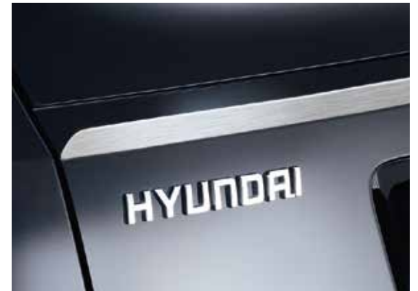
7.1) Heckklappenzierleiste, gebürstet