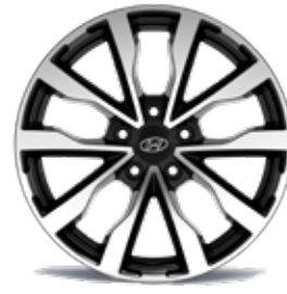
26) Leichtmetallfelge 18" Cortina