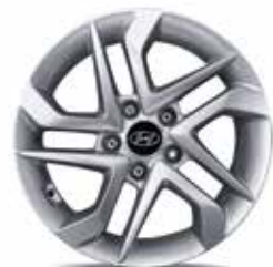
22) Leichtmetallfelge 16"