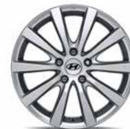
20) Leichtmetallfelge 17" Halla