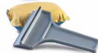
Winter Pflege Kit