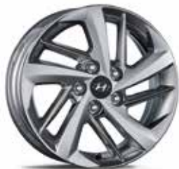
21) Leichtmetallfelge 16"