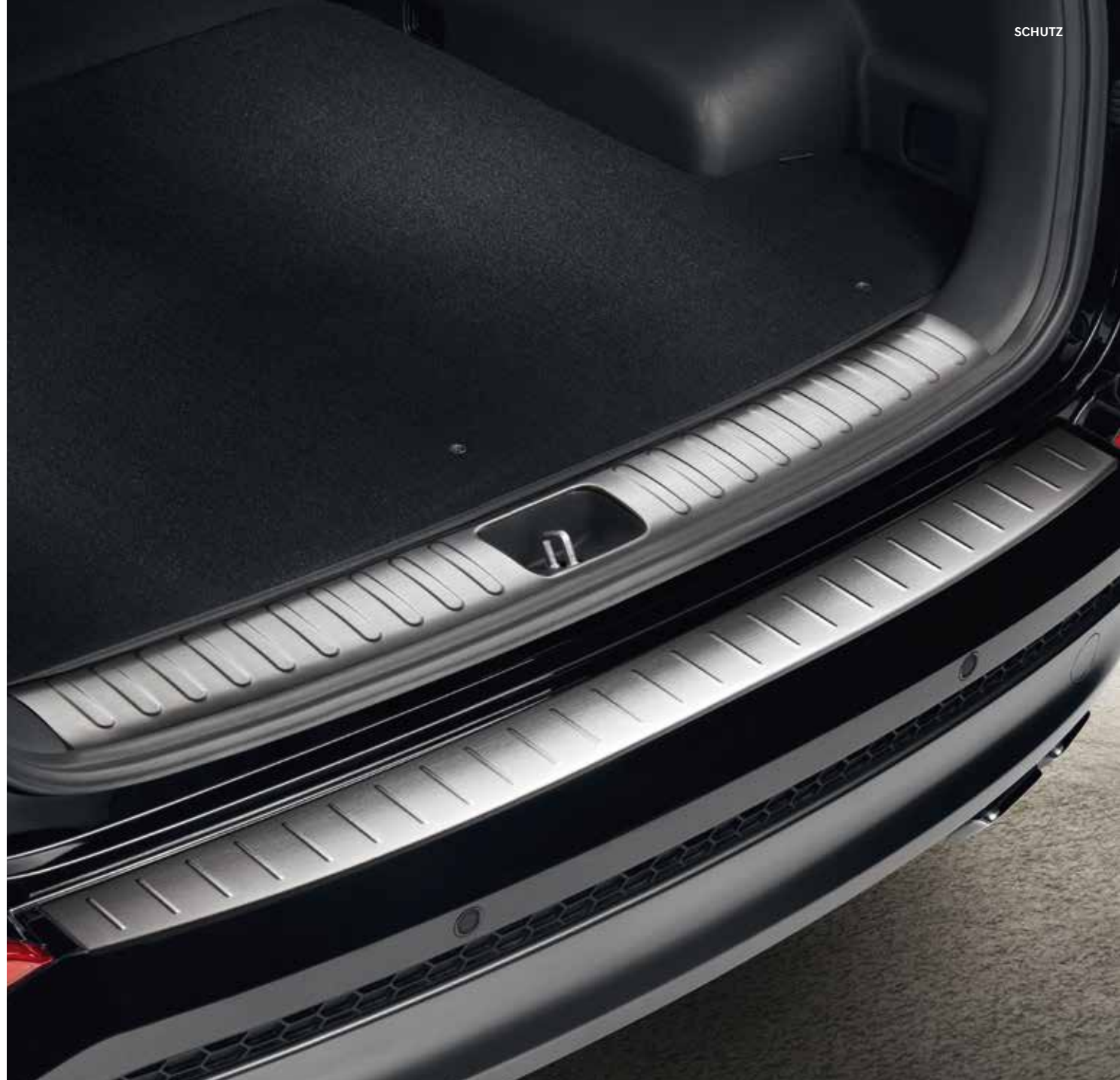
59.2) Ladekantenschutz & 60.2) Ladekantenschutz Innen (gebürstet)