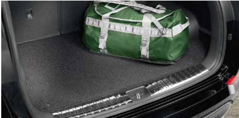
52) Kofferraummatte, zum Wenden