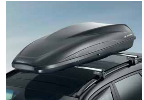
36) Dachbox 390