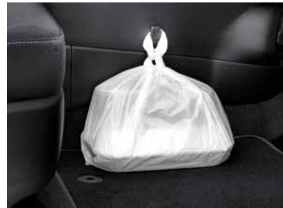
45) Take-Away Haken