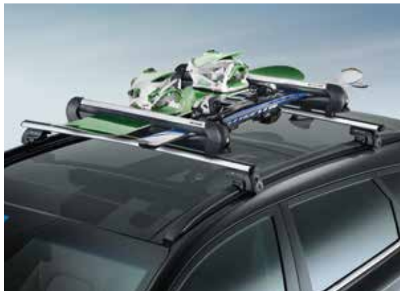
33) Ski- & Snowboardträgeraufsatz 600