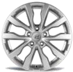
27) Leichtmetallfelge 18" Cortina