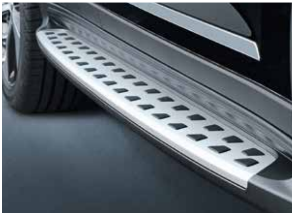
6) Trittbrett-Satz, Sporty