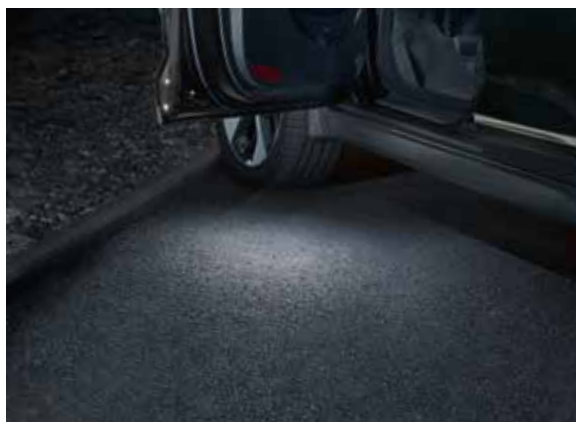
2) LED Einstiegsbeleuchtung