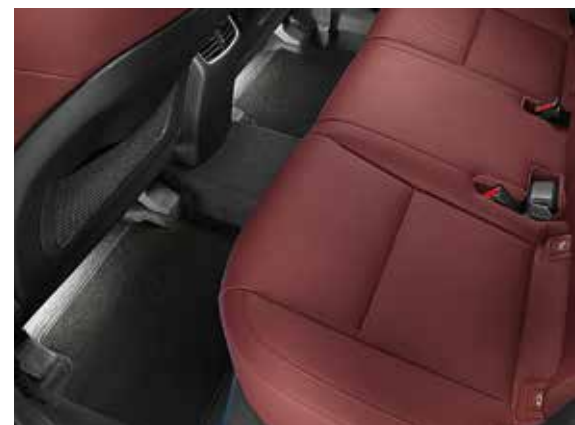
4.3) LED Fußraumbeleuchtung, 2. Reihe, weiß