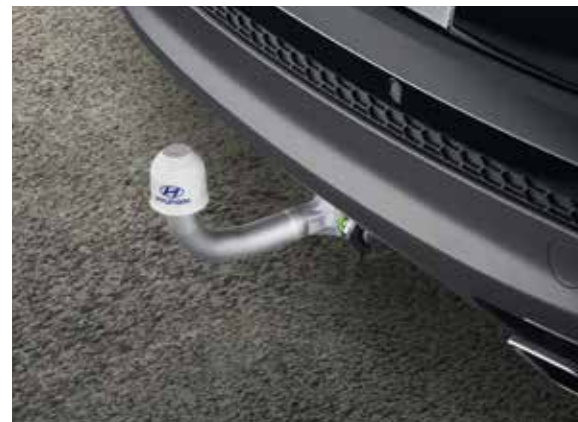
41) Anhängervorrichtung, vertikal abnehmbar

55622ADB00 (7-polig (Fahrzeug) auf 13-polig (Anhänger/Wohnwagen))