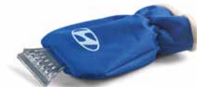
Eiskratzer mit Handschuh