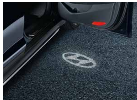
3) LED Türprojektoren, Hyundai Logo