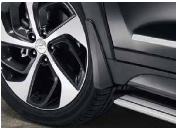
54.1) Schmutzfänger, vorne