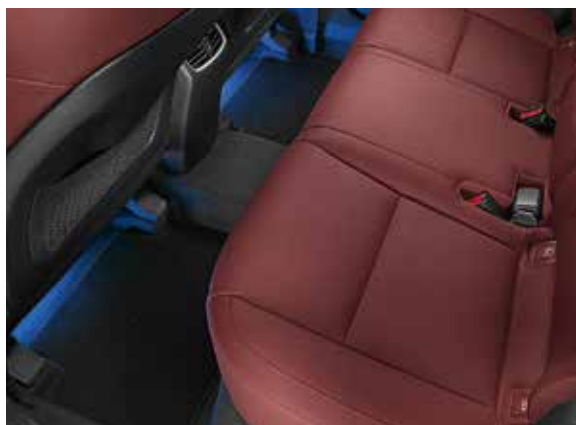
4.2) LED Fußraumbeleuchtung, 2. Reihe, blau