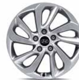
18) Leichtmetallfelge 17"