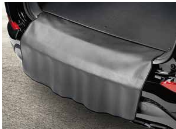
56) Ausklappbare Ladekantenschutzmatte