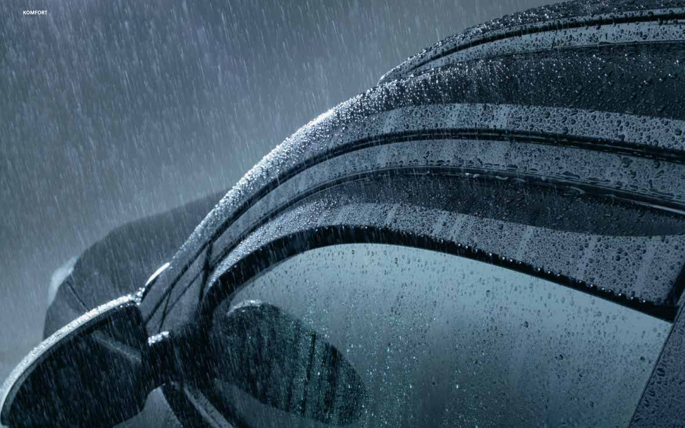
43) Seitenwindabweiser, vorne