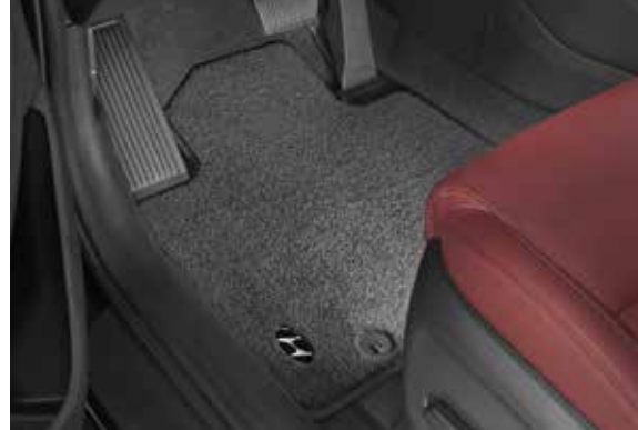
48) Velour-Matten-Satz, Premium

Set aus 4-Matten, die perfekt in die Vertiefungen des Fußraums passen. Hergestellt aus hochwertigem Velour mit Befestigungsöse. Die beiden Matten vorne haben ein Hyundai Logo in Schwarz/Silber (Metallguss). Mit Anti-Rutsch Unterlage. D7144ADE00 (MY 16) D7144ADE50 (MY 19)