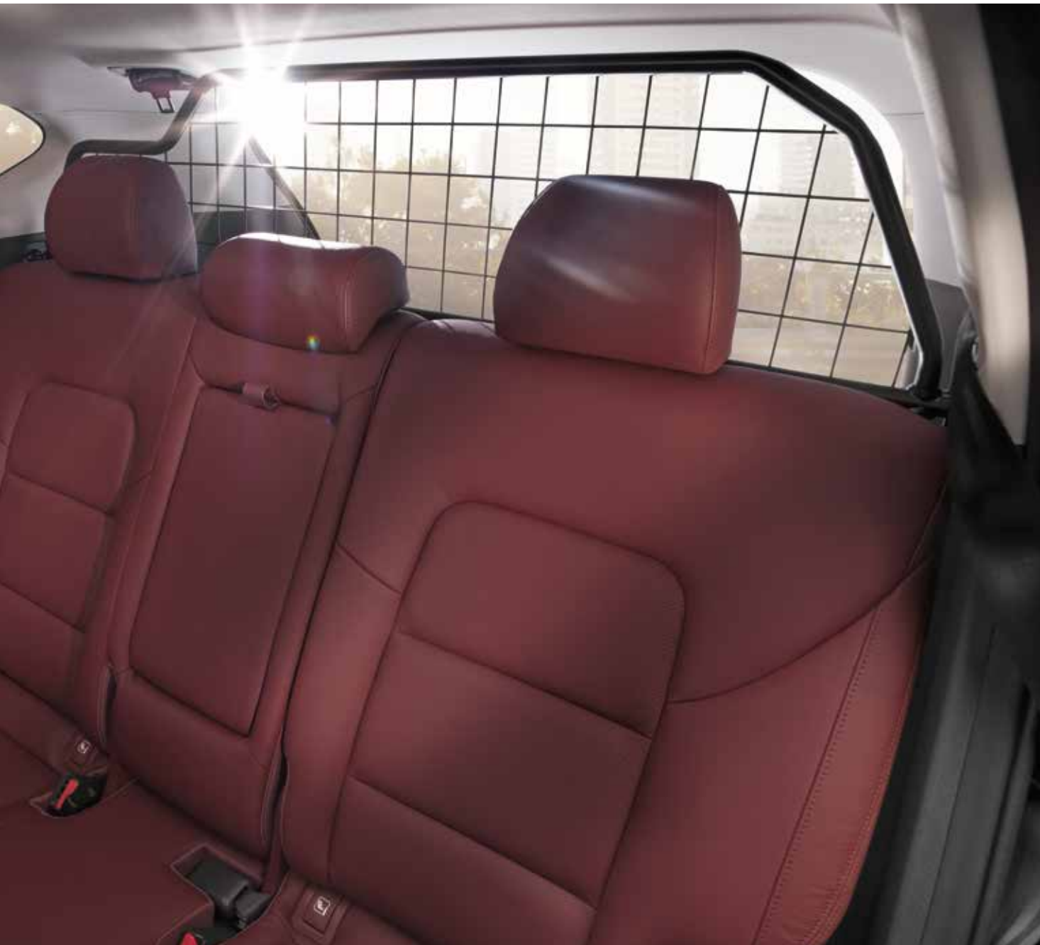
37) Trenngitter, Oberteil