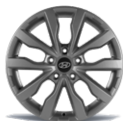
28) Leichtmetallfelge 18" Cortina