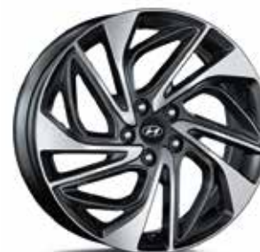
13) Leichtmetallfelge 19"

Attraktiv gestylte Leichtmetallfelgen verleihen Ihrem Tucson Eleganz und Sportlichkeit.