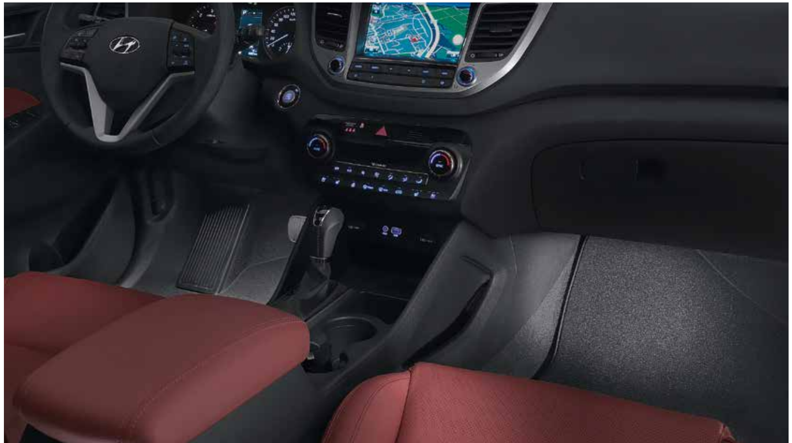
4.4) LED Fußraumbelichtung, 1. Reihe, weiß