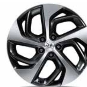
14) Leichtmetallfelge 19"